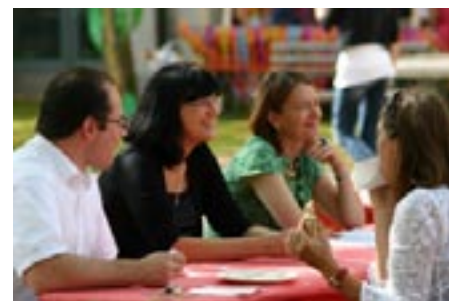
Schule kann sehr schön sein!

Der Erlös des Schulfestes, stolze 4060,98 Euro, wird am 21. Dezember 2010 beim Weihnachtskonzert der Schule feierlich der Haiti-Kinderhilfe aus Eichenau übergeben. Die Haiti-Kinderhilfe unterstützte bereits lange vor dem verheerenden Erdbeben im Januar 2010 humanitäre Projekte in Haiti. Gerade widmet sie sich auch dem Neubau einer Schule in einem Armenviertel in Port-au-Prince. Diese Schule, die den Namen Semences pour la vie (Samen für das Leben) trägt, wird unsere Spendengelder erhalten.