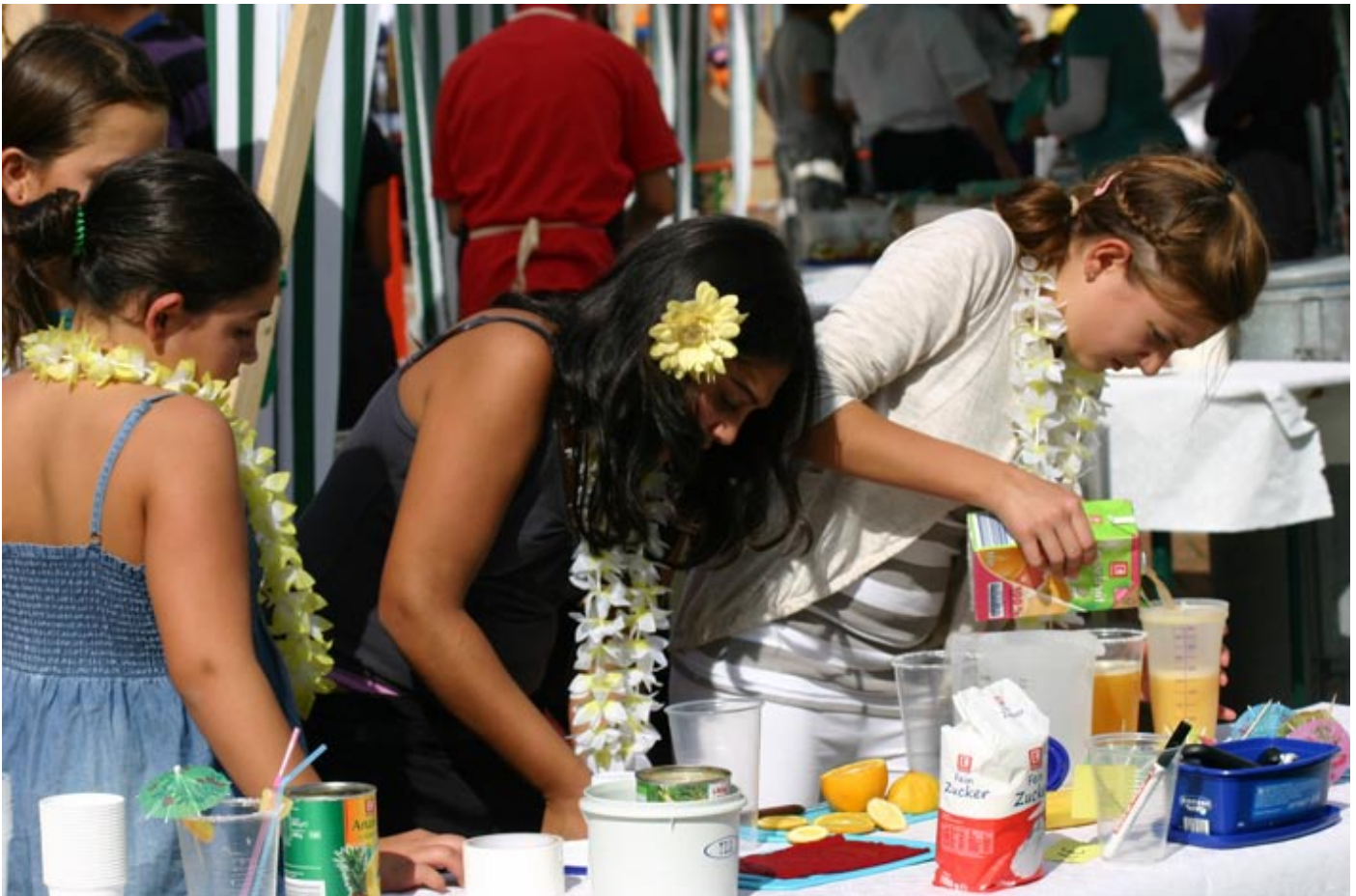
Karibische Atmosphäre am ITG. Das Herbstfest September 2010 unter dem Motto „Haiti - Schule hilft Schule“

Der Elternbeirat stellt sich vor >>> Wir wollten etwas Besonderes - Das Herbstfest am ITG >>> Neues aus der LEV (Landeselternvereinigung) >>> Nachgefragt beim Landratsamt >>> Klassenelternsprecher am ITG >>>