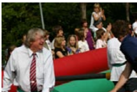
Wer hat den Ball?

Am 24. September war es dann endlich soweit. Bei strahlendem Sonnenschein und bester Laune wurde bereits ab zwölf Uhr mit dem Aufbau der Verkaufsstände unter tätiger Mithilfe von Schülern und Eltern begonnen. Um 15.00 Uhr schließlich ging es los. An den selbstgebastelten Ständen auf dem Schulhof wurde gehämmert, genagelt, gegrillt und vieles mehr.