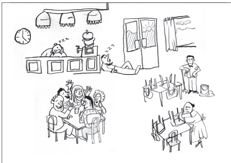
4.00 Uhr morgens - 7. Elternbeiratssitzung 2010